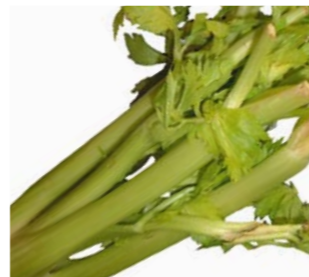
Sedano e sedano rapa