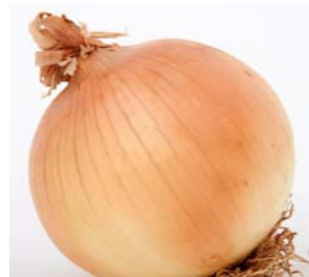
Cipolla e aglio (secchi)