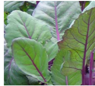
Cima di rapa