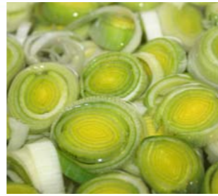
Porro e cardo