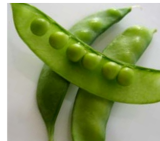
Piselli e fave