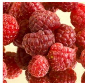
Frutti di bosco