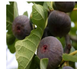
Fico e fico d'India